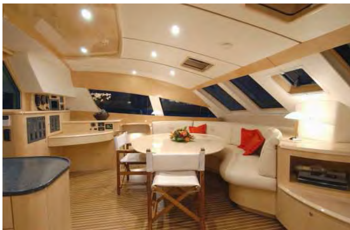
Table à cartes